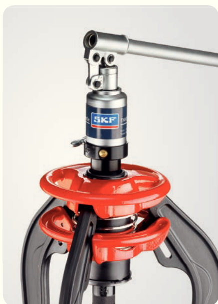
Гидропривод TMHS 100 показан вместе со съёмником TMMA 100H.